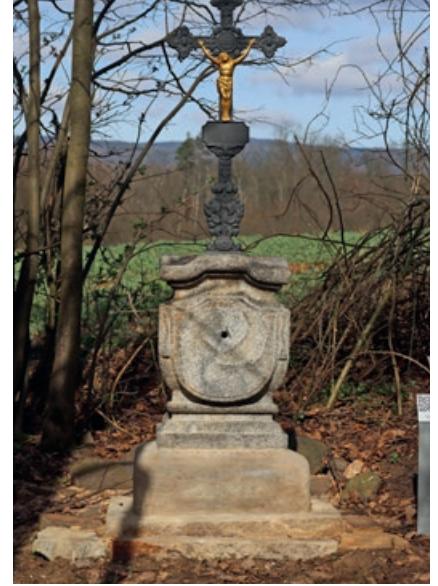
Křížek před Mořičovem po obnově, 17. 3. 2024