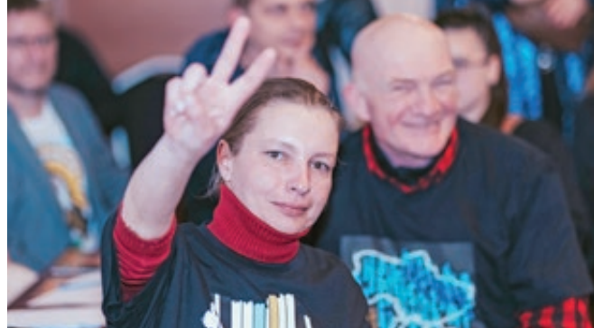
Foto z koncertu na podporu okupované Ukrajiny