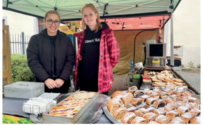
Kvalitní víno, domácí koláče a klobásy. To všechno na vás bude čekat v malebném prostředí klášterní zahrady