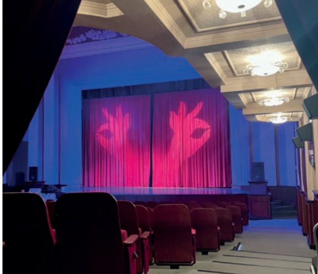
Rekonstrukce a modernizace ostrovskeho domu kultury bude sice již během podzimního filmového festivalu probíhat, ale do jeho programové skladby nijak nezasáhne