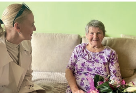
Paní Marii bylo pouhých sedmnáct, když se vdávala a nikdy prý svého rozhodnutí nelitovala

Zástupci radnice popřáli v uplynulých týdnech k výjimečnému životnímu jubileu hned několika devadesátníkům. Co mají společného? Když se ohlédnou, říkávají: „Život to byl pěkný...“