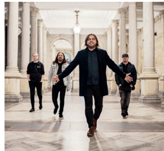
Ready Kirken přivezou do Ostrova spoustu svých hitů, foto: produkce DKO

Na Klášterních slavnostech se bude letos dokonce i létat ve vzduchu, foto: produkce DKO