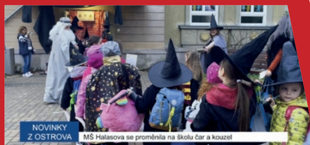
NOVINKY Z OSTROVA MŠ Halasova se proměnila na školu čar a kouzel