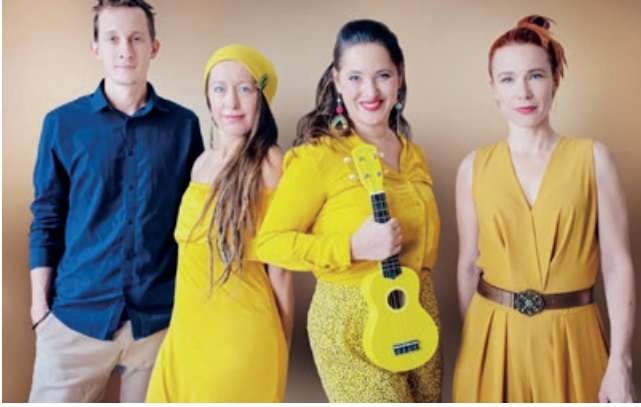
S Yellow Sisters čekejte sluncem prozářené písničky, nakažlivý humor a fajn energii