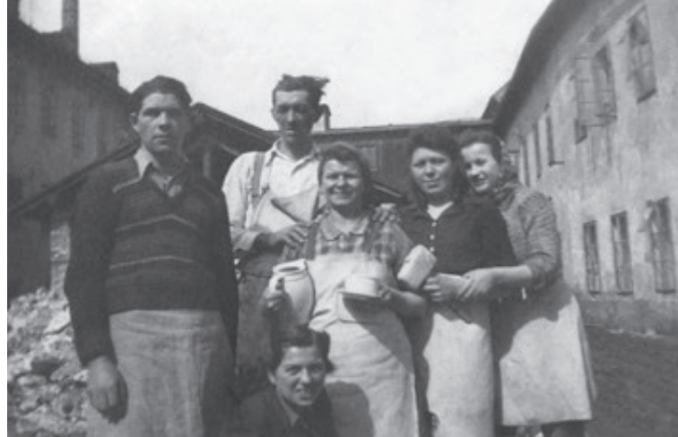
Zaměstnanci porcelánky PULS na dvoře továrny v dubnu 1947.