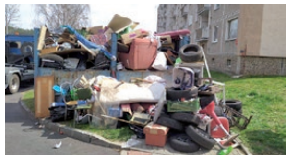
Takto vypadaly velkoobjemové kontajnery v loňském roce v ulici Lidická... ...a v ulici Jungmannova