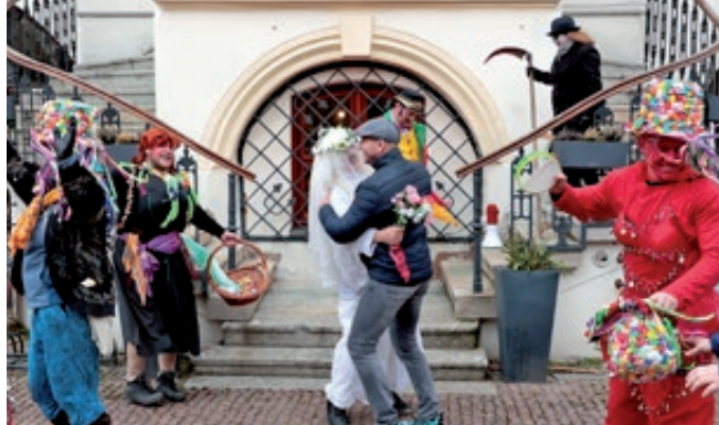
Účastníci si připomněli masopustní tradice