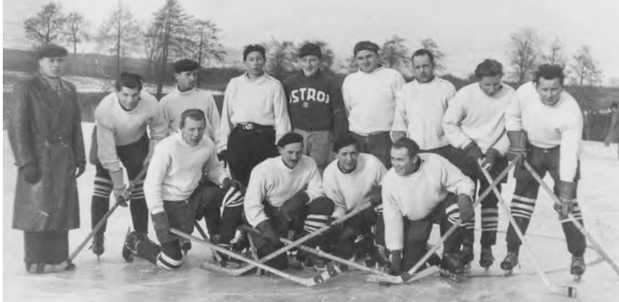
Hokejové družstvo Sokola Ostrov