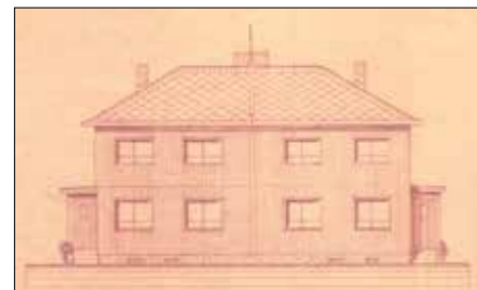
Plán přední strany dvojdomku, poskytl stavební úřad Ostrov

Dvojdomky byly jednopatrové dřevěné konstrukce na betonové podezdívce, plně podsklepené. Domek uprostřed dělí 25 cm silná zeď, která je vyvedena 15 cm nad okraj střechy. Dvojdomek je tak rozdělen na dvě samostatné bytové jednotky. Každý byt sestává ze sklepa a prádelny v suterénu, v přízemí je vstupní hala, záchod, kuchyně