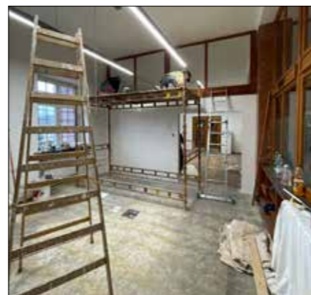
Vnitřní prostory domu kultury jsou postupně modernizovány