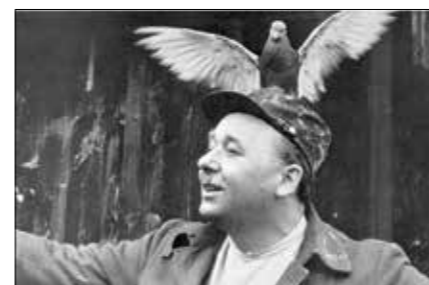
Z filmu Ostré sledované vlaky