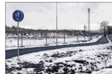
V Ostrově byla otevřena nová část cyklostezky, která vede podél bývalého závodu Škoda