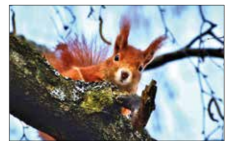
Zima je pro veverky nejklidnějším obdobím v roce

Nejklidnější část roku prožívají veverky v zimě. A i ty naše - v Zámeckém parku. Veverky jsou samotářská zvířata a svá teritoria si pečlivě chrání. V korunách stromů – 10 až 20 m nad zemí – si staví svá hnízda. Po většinu dne veverky v zimě spí, šetří energii, aby přežily celou zimu a mohly vyvést na svět mláďátka. To činí i třikrát do roka. Samička se potkává se samečkem jen za účelem páření a vychovává pak mláďátka sama. Do světa je pouští cca po 3 měsících.