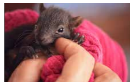
Na jaře se opět těšíme na veverčí mláďátka

Chcete-li veverky zhlédnout, je dobré jít do parku v toto roční období po ránu, kdy je park ještě v tichém a klidném závoji, má svoji atmosféru. Můžete si projít naučnou stezku, kde se o veverkách dozvíte plno zajímavostí, a zastavit se třeba u některého ze šesti krmítek. A abyste nešli s prázdnou, dopřejte veverkám nějakou tu mlsku, kterou koupíte