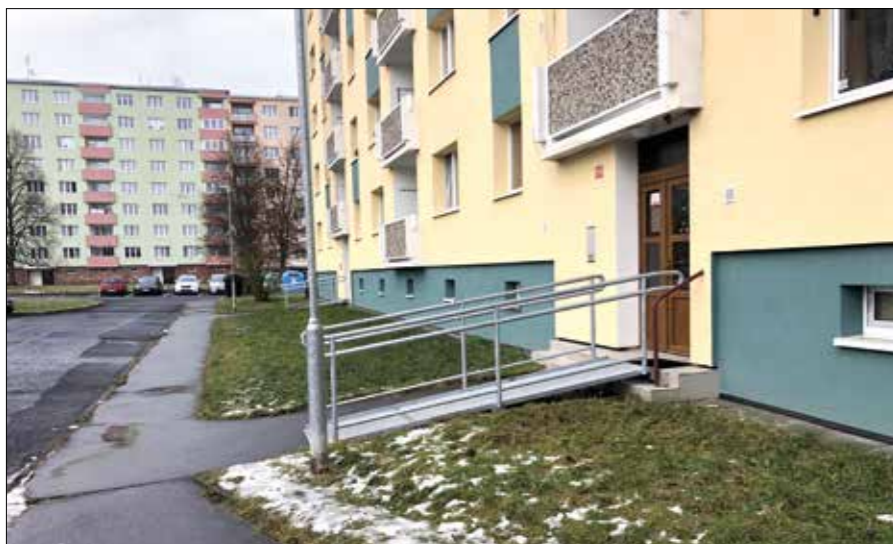
V Družební ulici přibýly nové nájezdové rampy