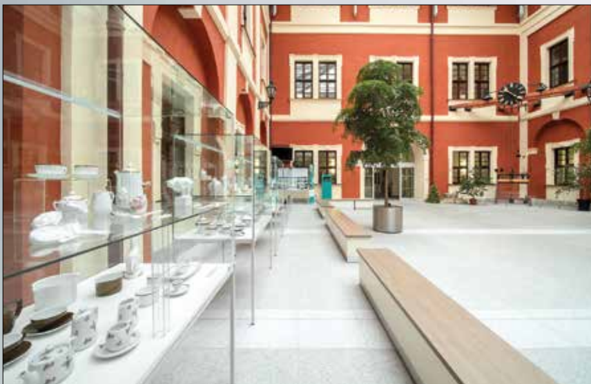
Část sbírky ostrovského porcelánu je vystavena ve Dvoraně ostrovského zámku

Zapsán byl jako součást sbírky s názvem Historická sbírka města Ostrov. K tomu, aby tato sbírka byla prohlášena kulturní památkou, zbývá už jen podat žádost doloženou odborným doporučením autorit v oboru. Samotné vyhlášení probíhá jedenkrát za dva roky a právě roku 2022 by k tomuto úkonu mohlo dojít.