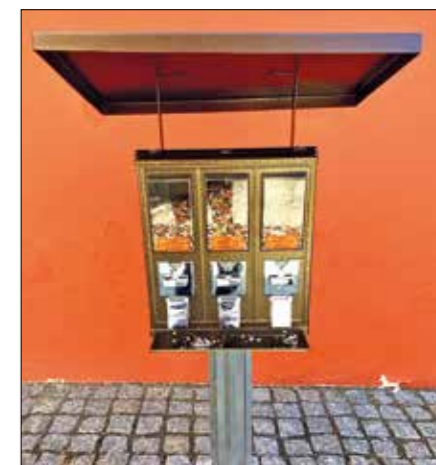
Krmítko pro veverky

Dita Poledničková manažer cestovního ruchu Městský úřad Ostrov