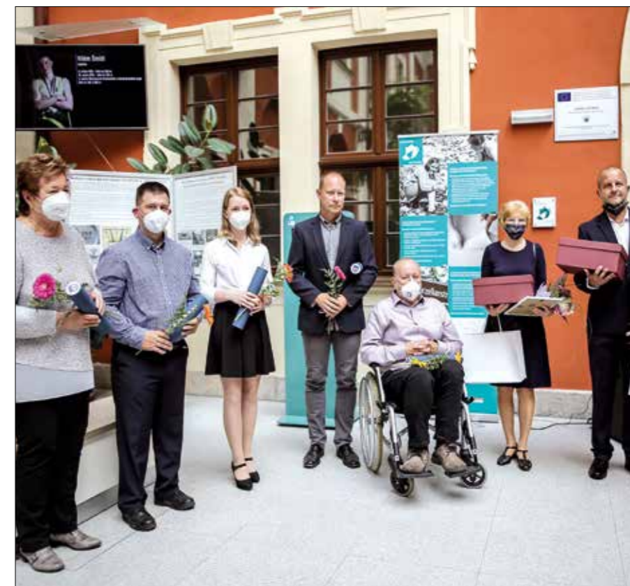
Ocenění občané města Ostrova za rok 2020