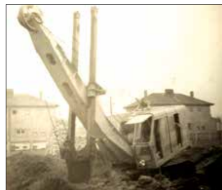
Výstavba nového Ostrova, 50. léta, sbírka Josef Macke

„Do Ostrova přišla stavět První slezská stavební společnost, která měla snad až na mistra Krotkého pracovníky samé cikány. Mistr Krotký byl vysoký, štíhlý chlap, který nosil a snad ani nesundával veliký černý klobouk... Nejdříve se stavěly tak zvané dvojdomky. Byly jednopatrové, dřevěné. Stavěla je První slezská stavební společnost. Cikáni, kteří byli jejími zaměstnanci,