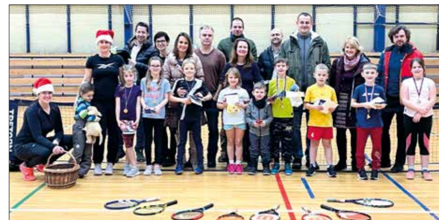
Ostrovští tenisté zakončili starý rok vánočními turnaji