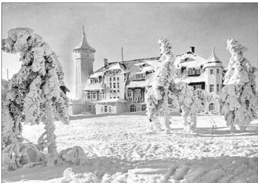
Zasněžený horský hotel Klínovec

... Začátek celého porevolučního problému stavu hotelu na Klínovci byl již v samotném počátku v rozhodnutí města Jáchymov prodat celý vrchol Klínovce (ne celé dva hektary) v devadesátých letech. Objekt včetně okolních pozemků se tak dostal do soukromého vlastnictví, byl naceněn podle obvyklých sazeb nemovitostí v Německu nebo Rakousku na 180 milionů Kč, aby mohl sloužit jako zástava pro další nákup spekulativních nemovitostí. Došlo to tak daleko, že vstup na samotný vrchol byl veřejnosti zakázán a ze slibovaných investic majitele zůstaly jen oči pro pláč. Následným několikerým přeprodáním skončilo vše až v exekuci, a tak se dostal hotel a pozemky do vlastnictví akciového věřitele. Mezitím komplex budov jen dál chátral až do neobyvatelného stavu. Nový majitel po očištění předmětných nemovitostí od věcných břemen je nabídl k prodeji s tím, že o ně měli zájem různí kupci především z východu, ale majitel vše přednostně nabídl městu Jáchymov za 28 milionů Kč. To však o koupí nemělo zájem a oslovilo město Boží Dar (BD), jestli nechce hotel a pozemky koupit. Kupní