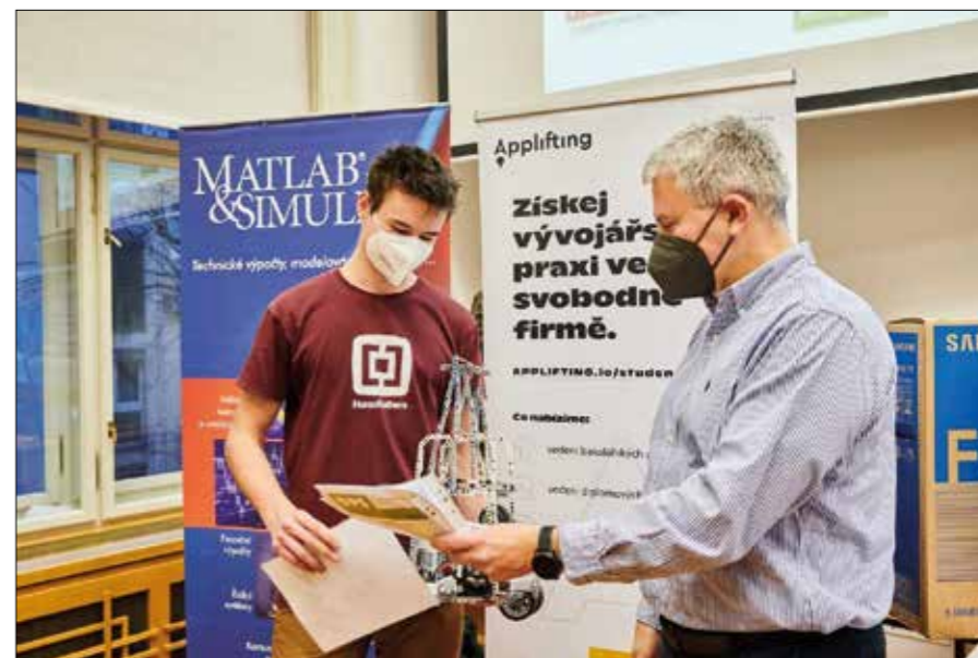
Ostrovští studenti získali hned dvě medaile v Robosoutěži pořádané elektrotechnickou fakultou ČVUT Praha