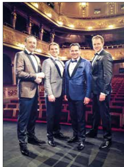
V Ostrově se představí 4 Tenoři