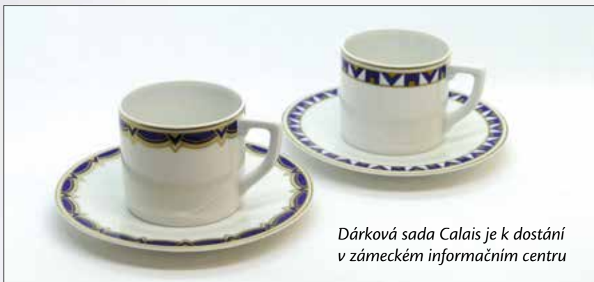
Dárková sada Calais je k dostání v zámeckém informačním centru