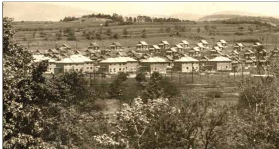
Dvojdomky a finské domky na dobové pohlednici

a obývací pokoj. První patro pak zabírají dva pokoje s šatnami. Schodiště je dřevěné, šíře 1 m. Topení lokální v kamnech.