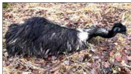
Strážníci honili u Mořičova zaběhnutého pštrosa