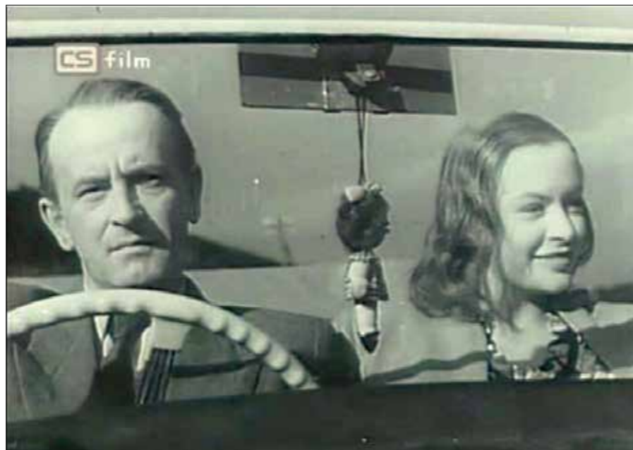
Z filmu Svědomí

Postupně vydával a redigoval politický a kulturní časopis „Telegram“ (1. prosinec 1969 – 31. prosinec 1975), byl dramaturgem a producentem montrealského Kanadského národního filmového úřadu (1974 až 1980), navázal spolupráci s manželkou Škvoreckými a s jejich nakladatelstvím '68 Publishers, psal pro exilový magazín „Reportér“ a angažoval se v kanadské Československé společnosti věd a umění. Roku 1988 odešel do penze.