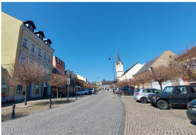
Obr. 02/ Prostranství náměstí je deformováno automobily

pozitivně ovlivnilo množství aut projíždějící po hranici MPZ. V současnosti je problematickým místem náměstí u Brány a prostranství před č.p. 167. Doporučujeme pro celou tuto oblast vypracovat urbanisticko-architektonickou studii.