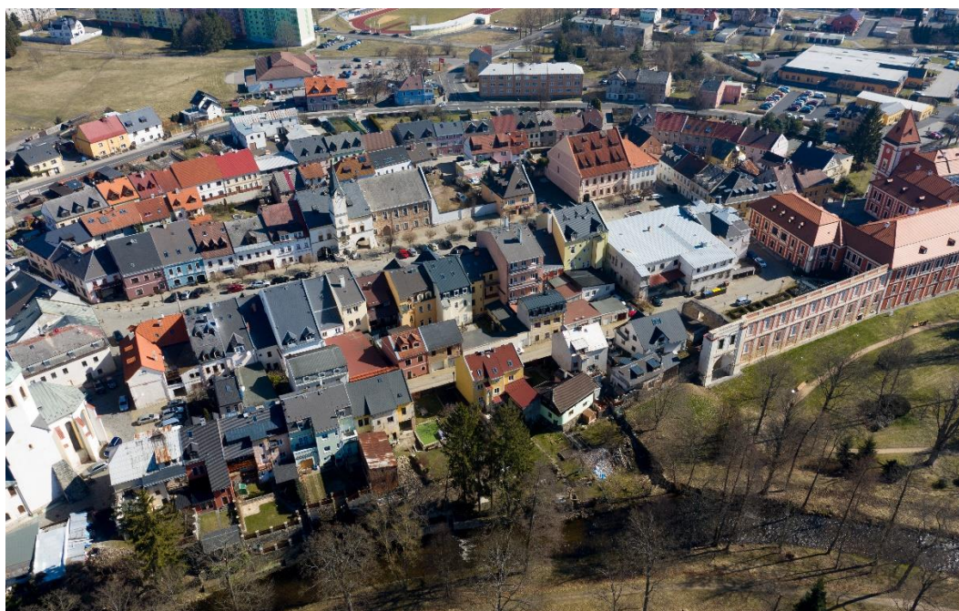
Obr. 06/ Současný stav střešní krajiny MPZ

Umístění nových technologií na střechu je možné pouze v případě, kdy se jedná o neexponovanou střešní fasádu a zásah je velmi malý. Vyhnout bychom se měli veškerým velkým klimatizačním a vzduchotechnickým jednotkám, velkým plochám solárních panelů apod.