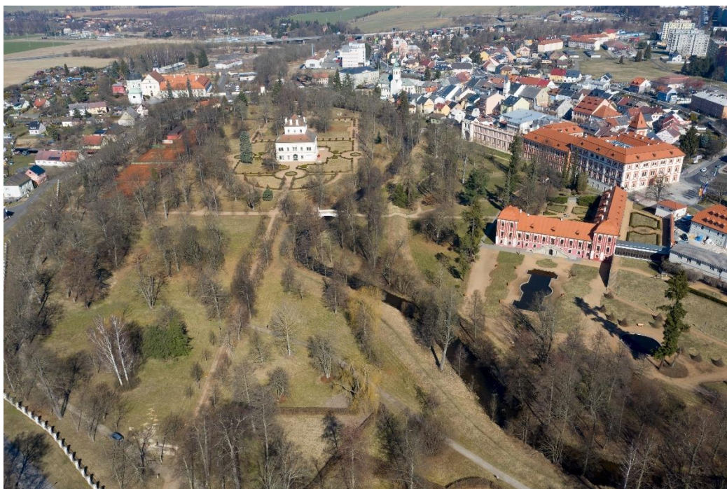
Obr. 04/ Kvalitní koncepce a údržba zámeckého parku

Město Ostrov má obrovskou devizu v podobě rozsáhlého zámeckého parku v těsném sousedství historického jádra. Jedná se o mimořádně kvalitní a hodnotnou urbanistickou koncepci z první poloviny 17. století. Na jeho současném stavu je jasně patrná soustavná údržba a pozornost, kterou mu město věnuje. Stromy v zámeckém parku jsou náležitě udržovány a vzrostlá zeleň je právem chloubou celého města. Jejich údržba a případná nová výsadba musí být podřízena celkové koncepci zeleně. Město by mělo vycházet z již vypracovaného generelu zeleně.