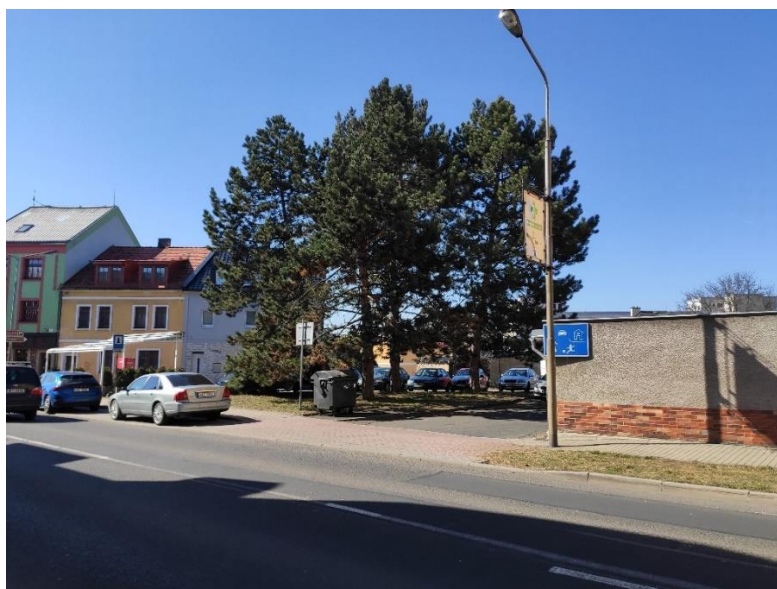
Obr. 03/ – Nevhodné vysoké jehličnany před č.p. 167

Nevhodná je nahodile založená zeleň, která se vymyká ucelené koncepci. Jedná se hlavně o prostor náměstí u Brány před č.p. 167, dále také lokálně na soukromých pozemcích. V prostoru historického jádra města by měly být vysazovány pouze listnaté stromy (neplatí pro zámecký park). V případě náměstí u Brány se jedná o jehličnany již velmi vysokého vzrůstu, které je vhodné pokácet a vysadit zde listnaté stromy s většími korunami. Viz výše doporučujeme pro celou tuto oblast vypracovat urbanisticko-architektonickou studii.