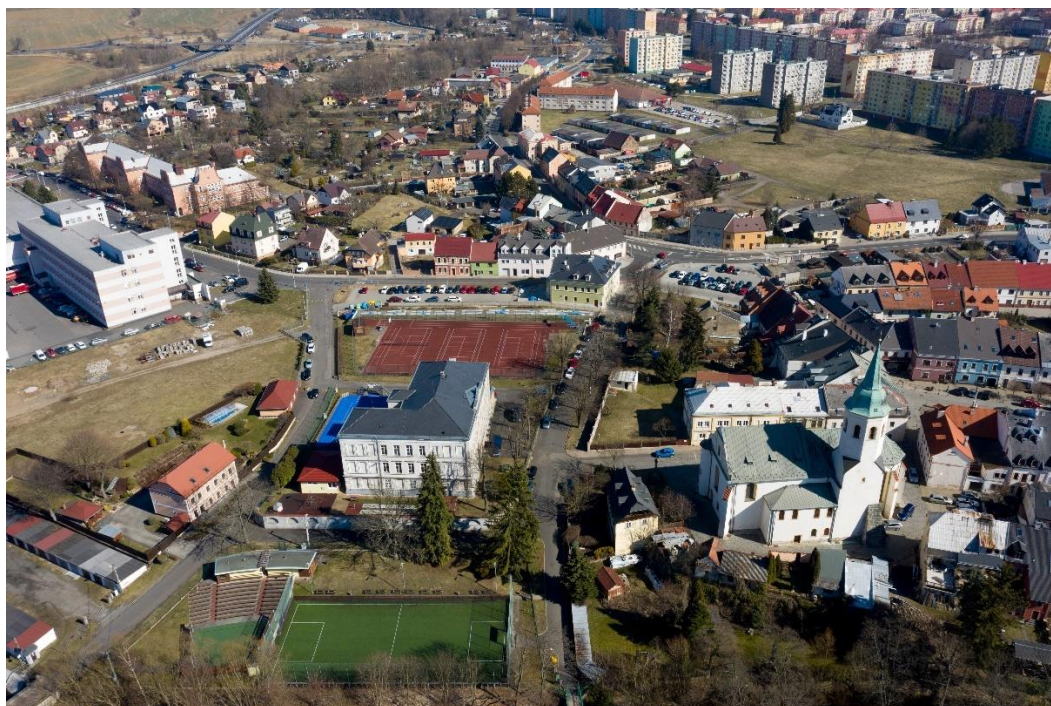
Obr. 05/ Pohled na plochy a ulice vhodné k úpravě (ulice Klášterní, Školní a Jáchymovská, prostranství u Brány, prostranství bývalé vlečky)

Konkrétně je v nevyhovujícím stavu ulice Školní a Klášterní, které by se měly obnovit s adekvátním povrchem a být doplněny o podélné parkovací stání. Pro prostranství okolo náměstí u Brány je doporučena vypracovat kvalitní architektonicky – urbanistická koncepce. Územní studie pro plochy v území Jáchymovské ulice a bývalé vlečky bohužel v řešení nezahrnuje toto problematické místo. Doporučujeme pro tuto konkrétní studii zohlednit průhledy a vazby mezi historickým centrem a okolní zástavbou, superblok v centru řešené oblasti se zdá být nevhodnou zástavbou, která svým měřítkem absolutně nezapadá do okolní zástavby. Ulice Jáchymovskou a Staroměstskou tvořící hranici MPZ doporučujeme citlivě renovovat s doplněním podélných parkovacích stání a stromořadí. Důležité je v tomto případě jemné navázání povrchů i prvků směrem z MPZ tak, aby nevznikla ostrá hranice.