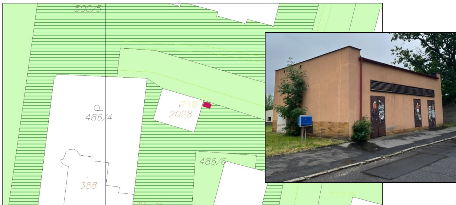
Původní předmět pronájmu

- v přemístění odkládací schránky z původního místa umístění „Ostrov, Družební 1282“ na pozemku p. č. 500/5 v k. ú. Ostrov nad Ohří,