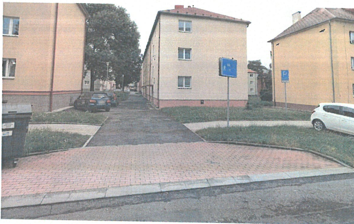
Obr. č. 5 – Foto stávající stav:

Městský úřad Ostrov odbor dopravně správní