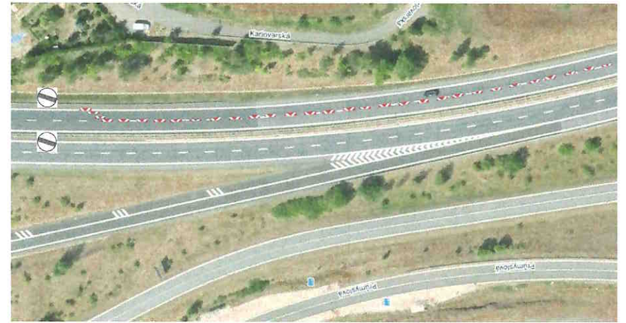
detail MÚK stan. km 7.900