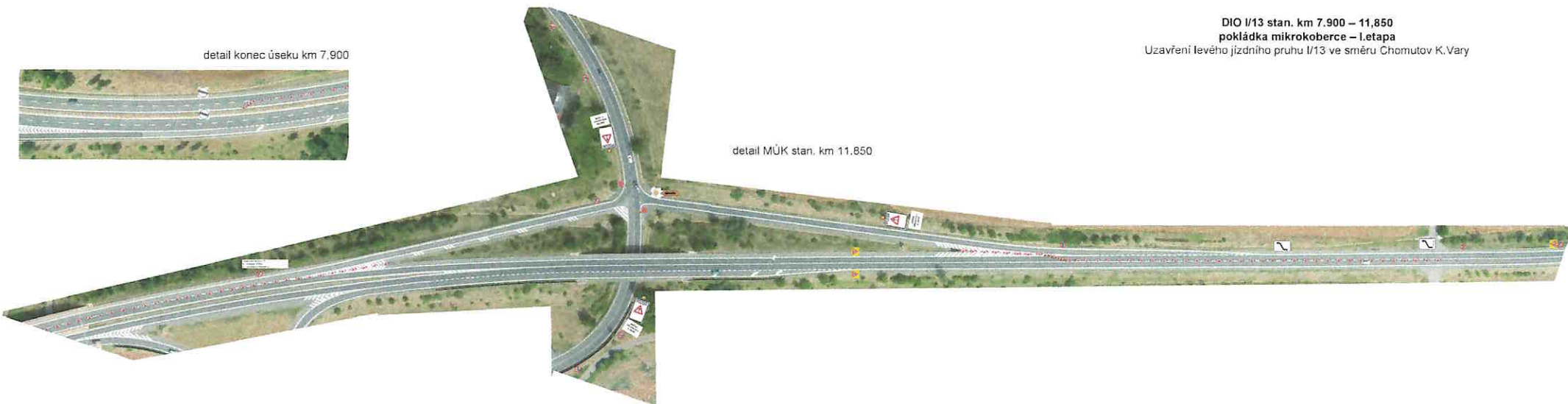
detail MÚK stan. km 11,850

SITUACNÍ PLÁN VE Z. KK/670/DK/25-V LIST 1/5; 14.4.25