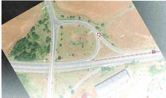
detail MÚK stan. km 11.000