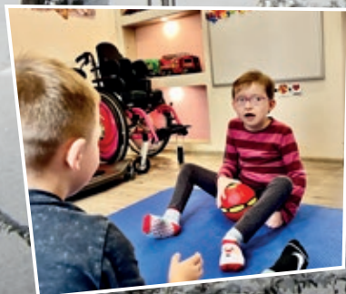
Str. 7 Podpořte sousedy a známé s nadací Srdce pro Ostrov

VŠEM ČTENÁŘŮM PŘEJEME POHODOVÉ VÁNOCE A HODNĚ ŠTĚSTÍ V NOVÉM ROCE