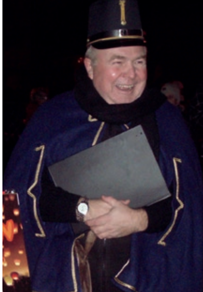
Při rozsvěcení vánočního stromu bude v neděli 3. prosince opět chodit Nebeský pošťák