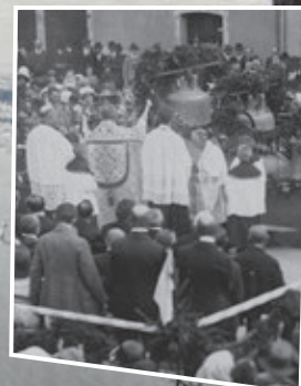
Str. 22 Naše město před sto lety v příbězích