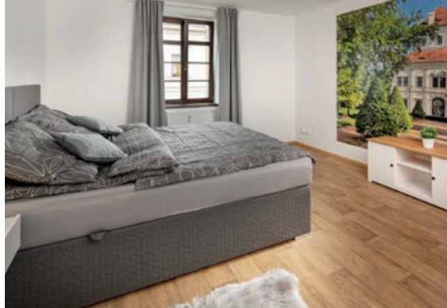
Ceník, popis a fotogalerie jsou k vidění na icostrov.cz/apartmany-myslivna/ , foto: Michal Hurých

Jeden apartmán má samostatnou ložnici s manželskou postelí a ve spojené kuchyňské části s obývací je možná přistýlka pro dvě osoby. Druhý apartmán disponuje dvěma samostatnými ložnicemi, z nichž jedna má manželskou postel a druhá dvě oddělená lůžka. V kuchyních je plně vybavená kuchyňská linka s elektrospotřebiči. V koupelně obou apartmánů je vana se zástěnou, umyvadlo, pračka, vysoušeč vlasů a sušák na prádlo. We má