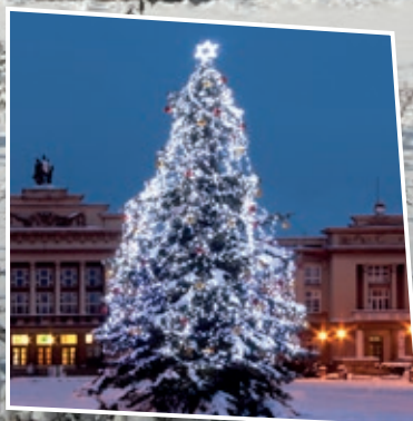
Str. 12 Nejkrásnější akce během adventu a Vánoc