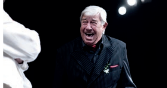
Foto z představení, Divadlo Na Fidlovačce

Aktuálně si v domě kultury můžete zakoupit vstupenky na divadelní