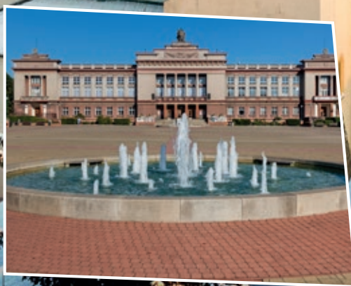
Str. 12 Nástěnný kalendář nejdůležitějších akcí v roce 2024