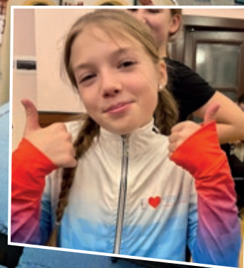
Str. 14 Taneční skupina Mirákl: tajemství úspěchu