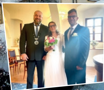
Str. 6 Novinky pro snoubence, jejich rodiče a přátele