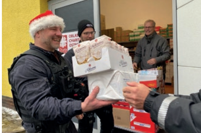
Strážníci se v minulosti se svou sbírkou připojili také k tradiční ostrovské akci Běh s čelovkou nebo společně připravovali balíčky s oblečením, hygienickými potřebami a potravinami pro lidi bez domova, foto: archiv MP Ostrov

Pěstounská péče na přechodnou dobu je krizový institut péče o ohrožené děti s tím, že jde o péči dočasnou – nejdéle může trvat jeden rok. O svěření dítěte