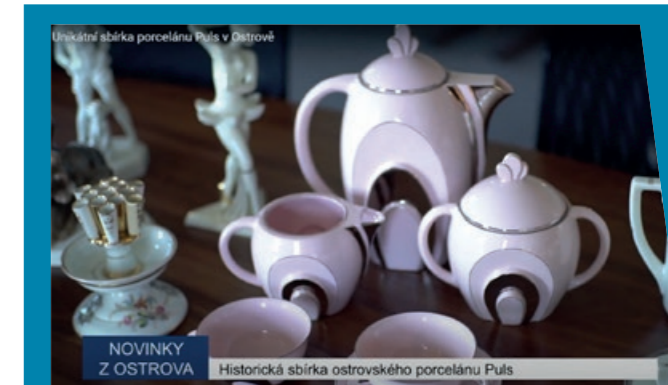
NOVINKY Z OSTROVA Historická sbírka ostrovského porcelánu Puls