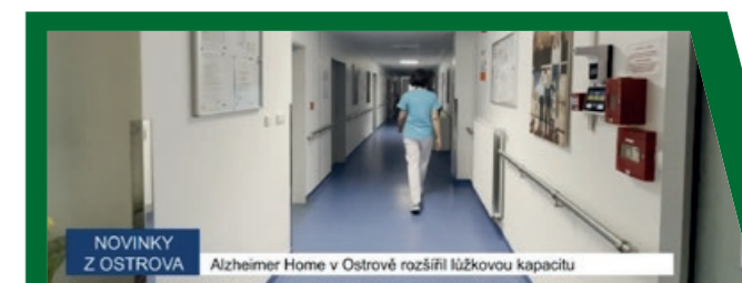
NOVINKY Z OSTROVA Alzheimer Home v Ostrově rozšíří lůžkovou kapacitu