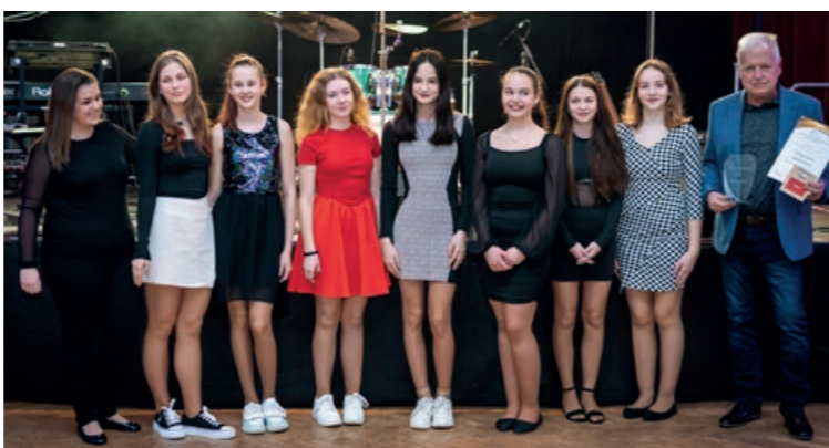
Mažoretky - MDDM Ostrov. TS Mirákl - ZUŠ Ostrov (spodní snímek)