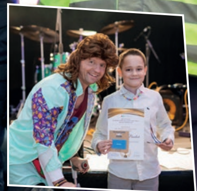
Str. 20 Velká sláva pro ostrovský sport