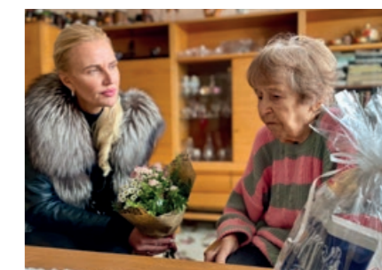
Připravila Lucie Kubešová