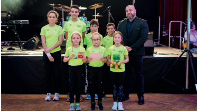
Atletika - MDDM Ostrov