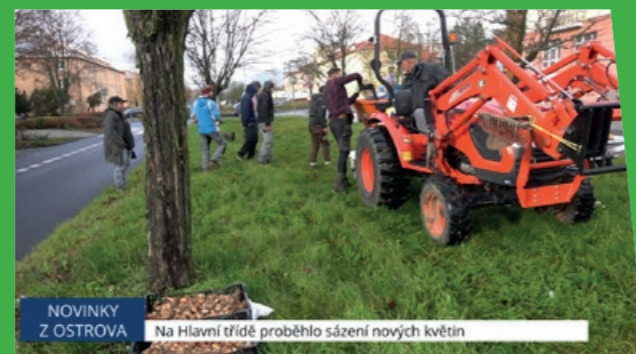
NOVINKY Z OSTROVA Na Hlavní třídě proběhlo sázení nových květin