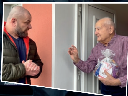
Str. 9 Jubilanti města: když je vám 90 plus