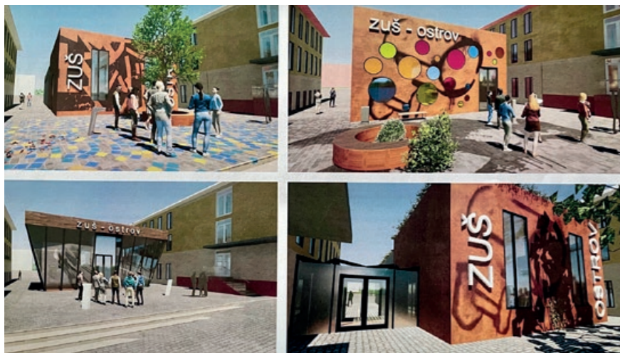
Jak šel čas: jednotlivé návrhy na budoucí vzhled přístavby ostrovské ZUŠ. Její konečná podoba bude známa na konci dubna