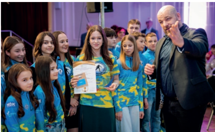
Biatlonový klub Ostrov