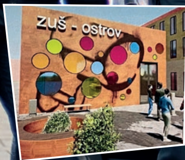
Str. 4 Talentované děti se dočkají