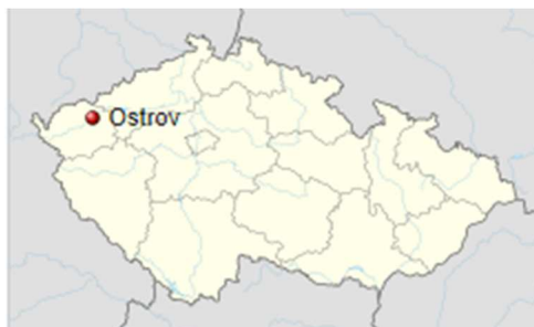
Obrázek 1: Lokalizace v rámci ČR 1

Součástí města jsou i místní části Arnoldov, Dolní Žďár, Hanušov, Hluboký, Horní Žďár, Kfely, Květnová, Liticov, Maroltov, Mořivoc a Vykmanov.