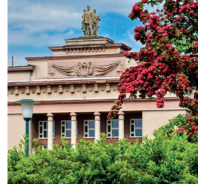
Dům kultury Ostrov